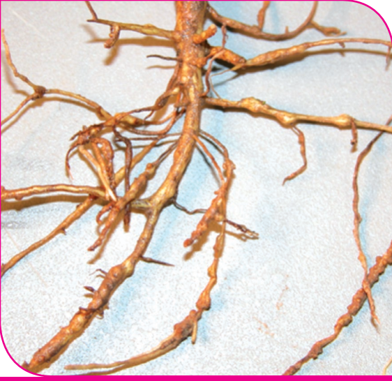
வேர்முடிச்சு நூற்புழுக்களினால் வேர்பகுதியில் ஏற்பட்டுள்ள முடிச்சுகள்