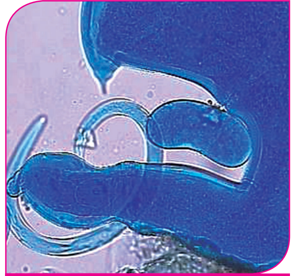
உருப்பெருக்கியில் பச்சை வடிவ நூற்புழுக்களின் தோற்றம்

விடுகிறது. பாதிக்கப்பட்ட செடியின் வேர்ப்பகுதி மெலிந்தும், காய்ந்தும் அடர்ந்த பழுப்புநிற கொப்புளங்களுடன் நிறம்மாறிக் காணப்படும். பாதிக்கப்பட்ட செடியின் வேர்ப்பகுதியை உருப்பெருக்கியில் பார்க்கும் போது சிறுநீரக வடிவ முதிர்ந்த பெண் நூற்புழுக்கள் முட்டை குவியலுடன் காணப்படும். இந்நூற்புழுக்களினால் பாதிக்கப்பட்ட செடியின் வேர்களை ஊதா நிறம் கலந்த நீரில் வைக்கும் போது வேர்ப்பகுதியில் ஒட்டிக் கொண்டிருக்கும் முதிர்ந்த பெண் நூற்புழு மற்றும் முட்டைகுவியல் ஊதாநிறமடைந்து காணப்படும்.