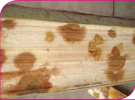
மட்டையில் பழுப்பு நிற புள்ளிகள் தோன்றுதல்