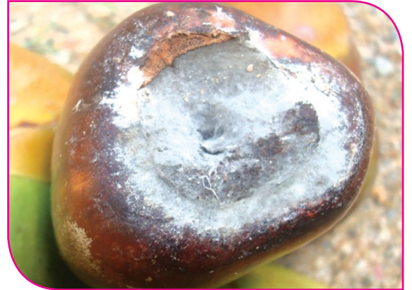
பூஞ்சாண வளர்ச்சி காய்களின் நுனிப்பகுதியை ஆக்கிரமித்தல்

உருக்குலைந்து காணப்படும். நோயின் தீவிரம் அதிகரிக்கும் போது, பூஞ்சாணம் பருப்புக்குள் பரவி முளை சூழ்தசையை (எண்டோஸ்பெர்ம்) கூட அழுகச் செய்யும்.