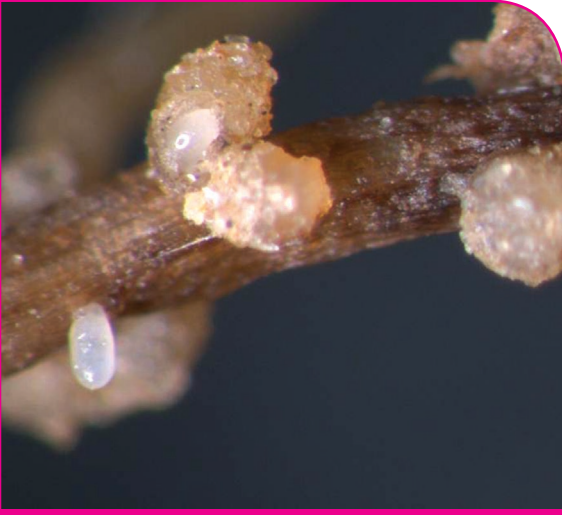
பருத்தியின் வேர்ப்பகுதியில் முட்டைக் குவியலுடன் மொச்சை வடிவ முதிர்ந்த பெண் நூற்புழு