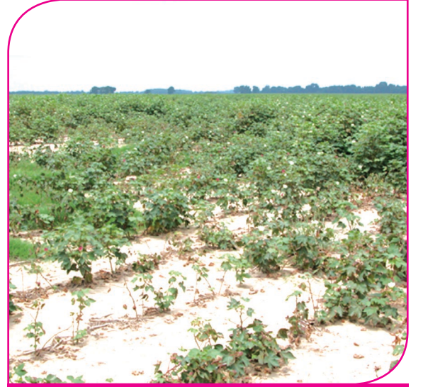
வேர்முடிச்சு நூற்புழுக்களினால் மிகவும் பாதிப்படைந்த பருத்தி வயல்

ஊட்டச்சத்து பற்றாக்குறையினால் ஏற்படும் அறிகுறிகள் போன்றே காணப்படும்.